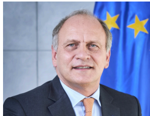
CHARLES-MICHEL GEURTS ACTUAL EMBAJADOR DE LA UNIÓN EUROPEA EN ECUADOR

Estamos convencidos que apoyando a las Mipymes contribuimos al desarrollo sostenible del Ecuador. Los resultados obtenidos con iniciativas como "Export - DES", implementado por CORPEI, respaldan esta posición. Al cierre del proyecto, se realizaron 152 participaciones en eventos internacionales; se concretaron 62 cierres de negocios; 60 empresas mejoraron sus sistemas de gestión de calidad; 49 adecuaron su etiquetado y empaques a estándares europeos; y 33 implementaron estrategias de comunicación para mejorar su visibilidad. Además, se favoreció a proyectos asociativos de la economía popular y solidaria promoviendo la participación de mujeres, jóvenes, indígenas y afro ecuatorianos; beneficiando a más de 3000 productores agrícolas.